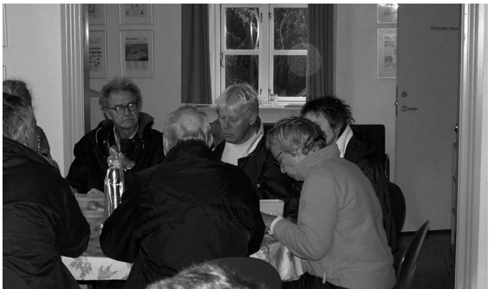
Men så er det jo godt, at man kan komme indendøre.