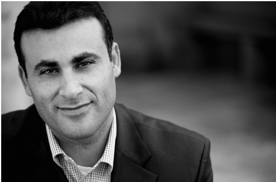
Naser Khader er radikalt folketingsmedlem og giver sit bud på at være dansker og muslim på samme tid.