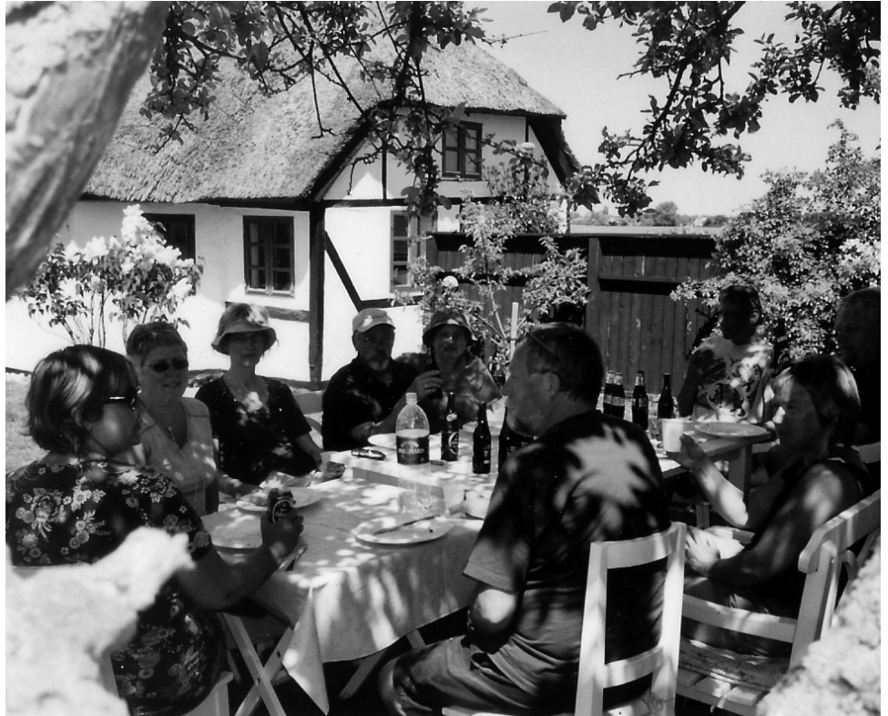
Idyl på Langeland.