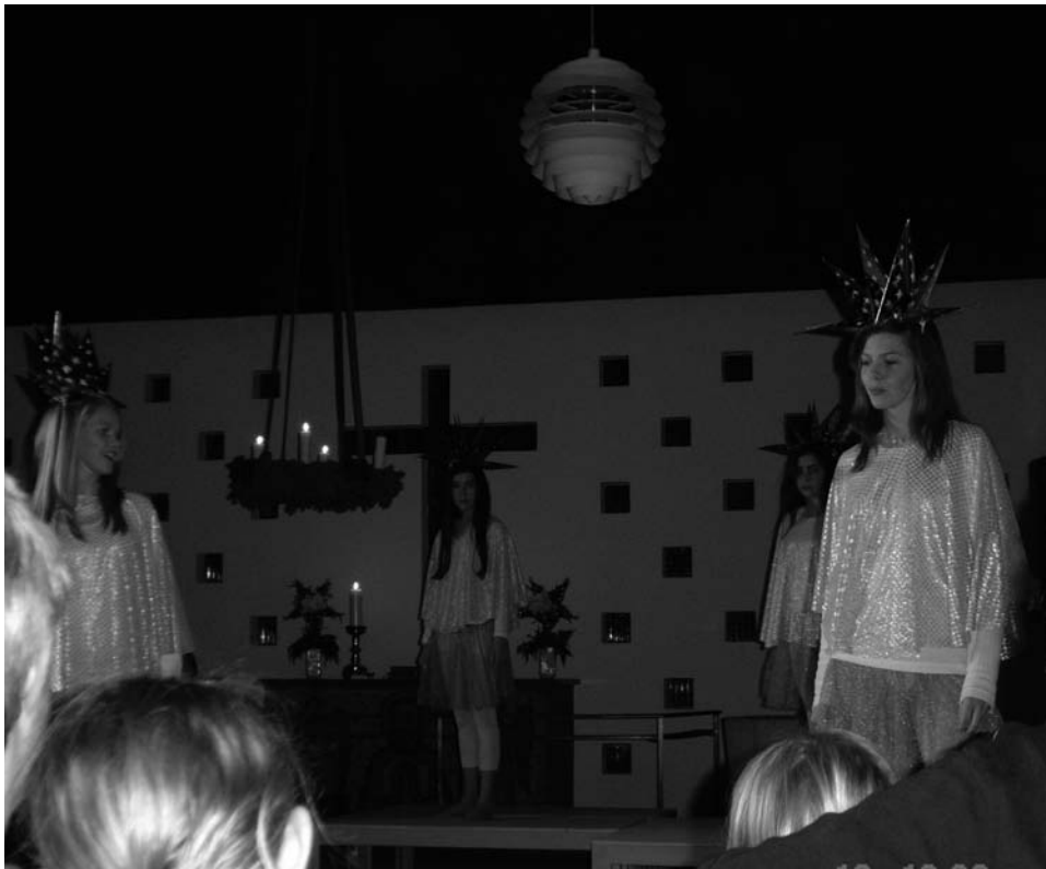
De fire julestjerner bandt handlingen i årets julespil sammen.