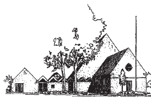
HANS TAUSENS KIRKE