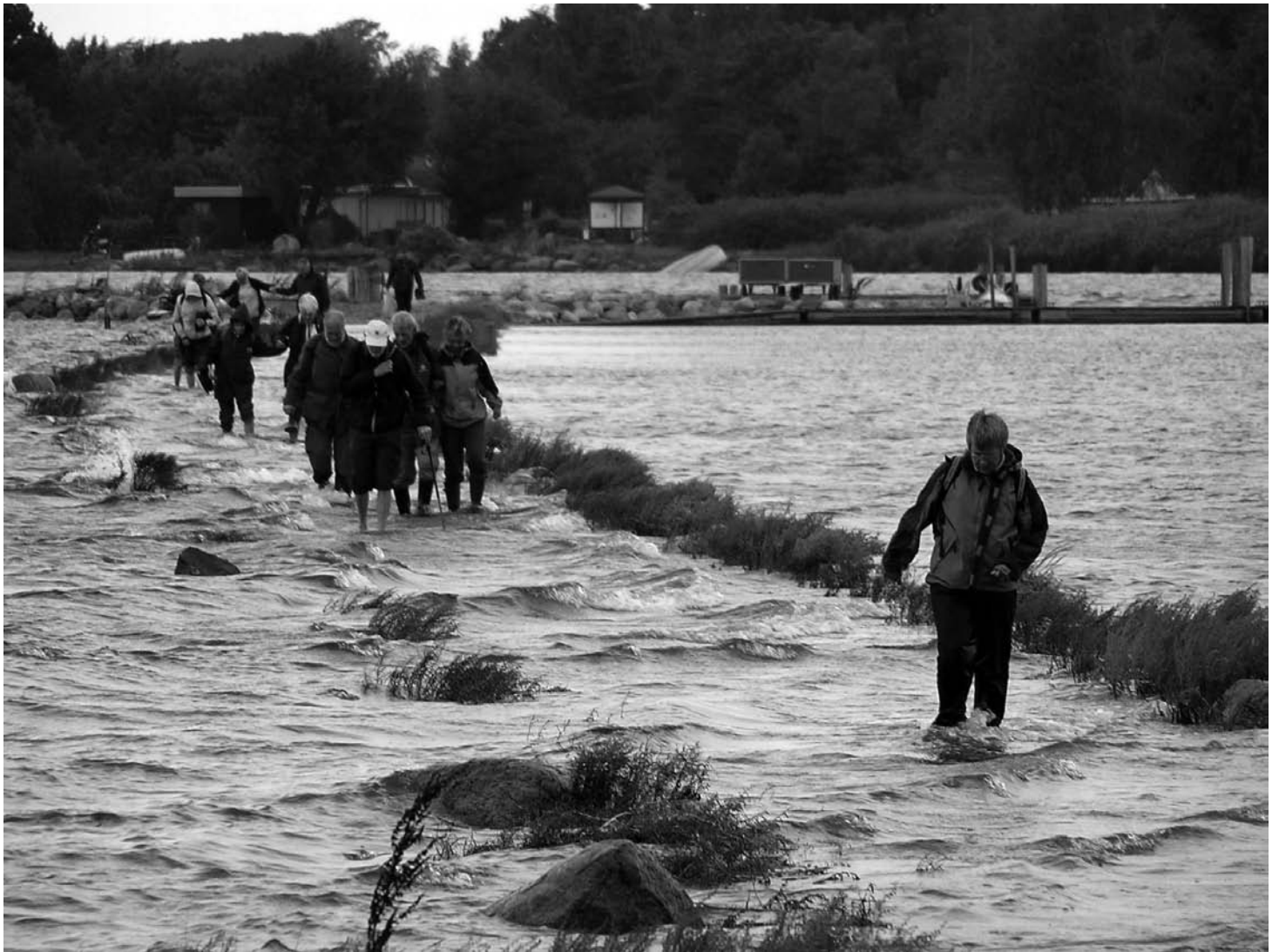
Der findes som bekendt ikke dårligt vejr - kun dårligt valg af tøj. Viggelsø viste sig fra sin vådeste side.

blevet oversvømmet igen, og området er blevet generobret af fugle, frøer og insekter. Flere sjældne arter har fundet vej til området.